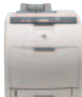
Ref: Q5982A HP COLOR LASERJET 3800n

Qualitativ hochstehende Farbdruke für mittelgrosse Arbeitsgruppen bis 10 Anwender.