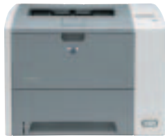
Ref: Q7814A HP LASERJET P3005n

Professioneller und leistungsfähiger Laserdrucker für vernetzte Arbeitsteams.