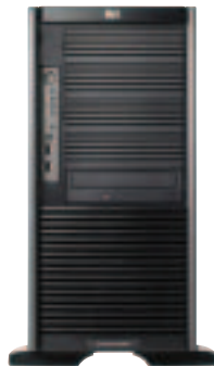
Ref: 470064-104 HP PROLIANT ML350 G5 Der bekannte Server mit den neuesten Merkmale.

Intel® Pentium® D Prozessor 930 (3,00 GHz, 2 x 2 MB L2 cache) 512 MB Hauptspeicher, max. 8 GB 72 GB SCSI Festplatte, max. 4 Single Channel SCSI Adapter 1 Jahr Garantie, Vor-Ort