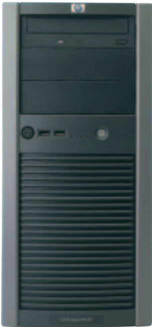
Ref: 470063-972 HP PROLIANT ML310 G3 Für aufstrebende Teams.

Sparen Sie bis zu CHF 600.- Wir machen Ihnen den Umstieg auf die neue Server Generation einfach und attraktiv. Profitieren Sie von unserem Trade-In Programm. hp.com/ch/tradein