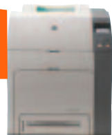
Ref: Q7492A#420 HP COLOR LASERJET 4700n

Leistungsstarker Drucker: ab 3000 Seiten/Monat kostengünstiger als HP Color LaserJet 3800n.