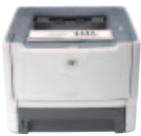
Ref: CB449A HP LASERJET P2015n

Netzwerkfähiger Drucker für kleine Teams - ohne Aufwärmzeit!